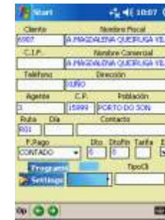
Ficha de cliente