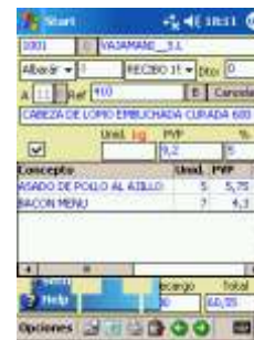
Albarán o Pedido