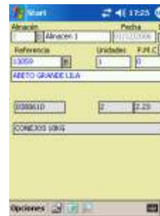
Captura de Inventario