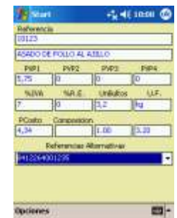
Ficha de artículo