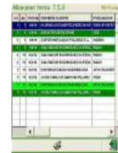
Conexión On line